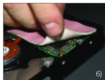
Рис.4. Применение материала Gap Pad VO (а) и Gap Pad VO Soft (б)

ненты на плате. Полимеризация в зависимости от типа материала происходит в течение нескольких часов при комнатной температуре либо в течение 5 мин при 100°C. Таким образом, без силового воздействия на элементы печатной платы, на ее поверхность наносится теплопроводное и одновременно электроизолирующее покрытие, толщина которого может быть сколь угодно мала. Материалы Gap Filler выпускаются как на основе кремнийсодержащих компонентов, так и без них. У них отличные теплопроводные и электроизолирующие характеристики, высокая механическая и химическая устойчивость как при высоких (до 200°C), так и при низких (-60°C) температурах. Важно также отметить, что при необходимости поверхность печатной платы легко очищается от этих материалов.