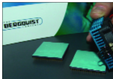
Рис.3. Материал Hi-Flow 625, разработанный для тепловых интерфейсов, требующих электрической изоляции охлаждаемого прибора от кулера

Особый интерес для разработчиков электронной аппаратуры представляют материалы группы Gap Pad. Благодаря специальному теплопроводному изолирующему полимеру они чрезвычайно легко деформируются, плотно прилегая ко всем компонентам на печатной плате (рис.4). Материалы Gap Pad можно использовать для отвода тепла от печатной платы целиком, при этом функцию радиатора может выполнять металлический корпус устройства. Материалы этой группы различаются значениями теплопроводности, толщиной, необходимым усилием прижима к поверхности платы.