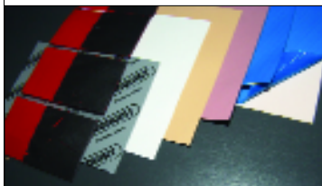
Рис.2. Эластичные материалы компании Bergquist. Слева направо: Hi-Flow-225U, Sil-Pad K-4, Sil-Pad A2000, Poly-Pad K-10, Sil-Pad 900S, Gap Pad 2500-S20 (защитная пленка синего цвета)

В семейство Sil-Pad входят два десятка пленочных материалов различных наименований толщиной 0,13–0,38 мм с пробивным напряжением 1,7–6,0 кВ и теплопроводностью 0,9–3,0 Вт/м·К. В их числе такие специальные материалы, как Sil-Pad 1750 и Sil-Pad 1950, предназначенные для работы в условиях повышенной влажности; Sil-Pad 800-S и Sil-Pad 900-S, обеспечивающие низкое